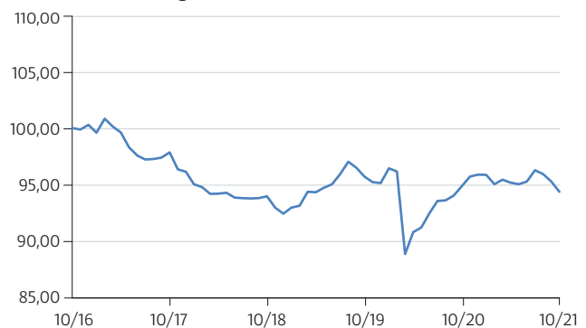
— HYPO VORARLBERG ZINSERTRAG GLOBAL (R) (A)